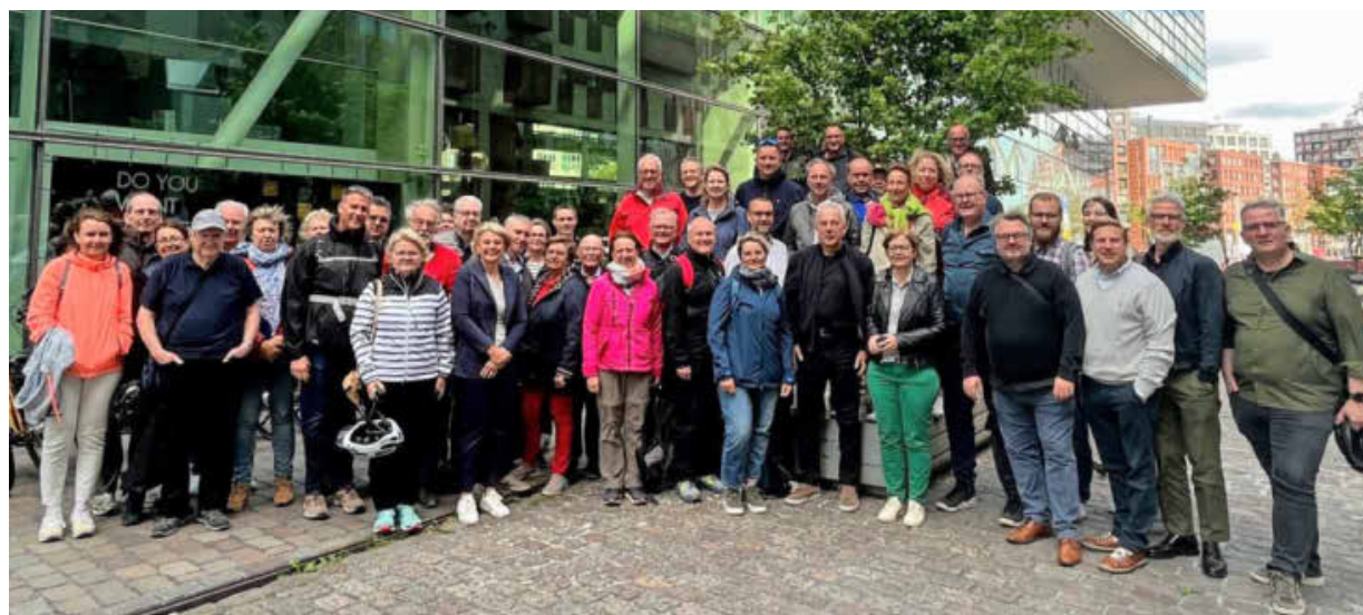
Der Heilbronner Gemeinderat besuchte auf seiner Fachstudienreise die niederländische Hauptstadt Amsterdam.

Autos sollen in Zukunft immer mehr aus der Amsterdamer Innenstadt verdrängt werden. Schon heute sind die Menschen in der 930 000 Einwohner zählenden Metropole vor allem mit dem Fahrrad unterwegs. Allein unter dem Hauptbahnhof steht eine Parkanlage zur Verfügung mit 30 000 kostenlosen Stellplätzen. (pin)