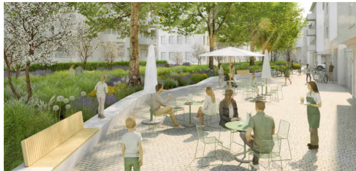
Auch in der Zehentgasse ist deutlich weniger Verkehr als heute denkbar. Stattdessen könnten ebenfalls Grün- und Freiflächen die Aufenthaltsqualität stärken. Visualisierungen: ARGE Biegert Hink sowie Raumlabor 3/Thorsten Kraemer

Eine Ausstellung im Wollhaus zeigt alle zwölf eingereichten Arbeiten, der Zugang ist barrierefrei und erfolgt von der Fußgängerzone. Die Ausstellung ist bis zum 21. Juli montags bis freitags von 13 bis 17 Uhr und samstags von 11 bis 15 Uhr geöffnet. Der Eintritt ist frei.