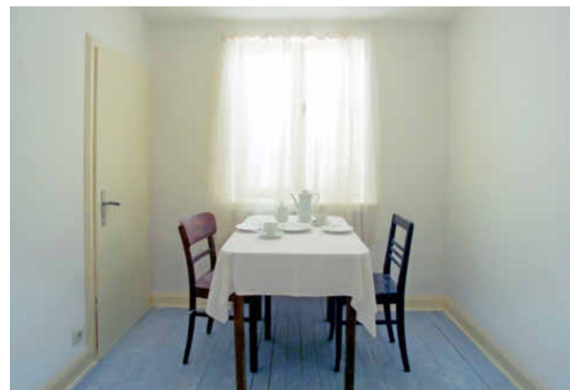
Das Projekt u r 10, Kaffeezimmer, aus dem Jahr 1993. Foto: VG Bild-Kunst, Bonn 2023/Gregor Schneider

INFO: Die Ausstellung Gregor Schneider in der Kunsthalle Vogelmann, Allee 28, ist bis zum 29. Oktober dienstags bis sonntags von 11 bis 17 Uhr (donnerstags bis 19 Uhr) zu sehen. https://museen.heilbronn.de/kunsthalle-vogelmann