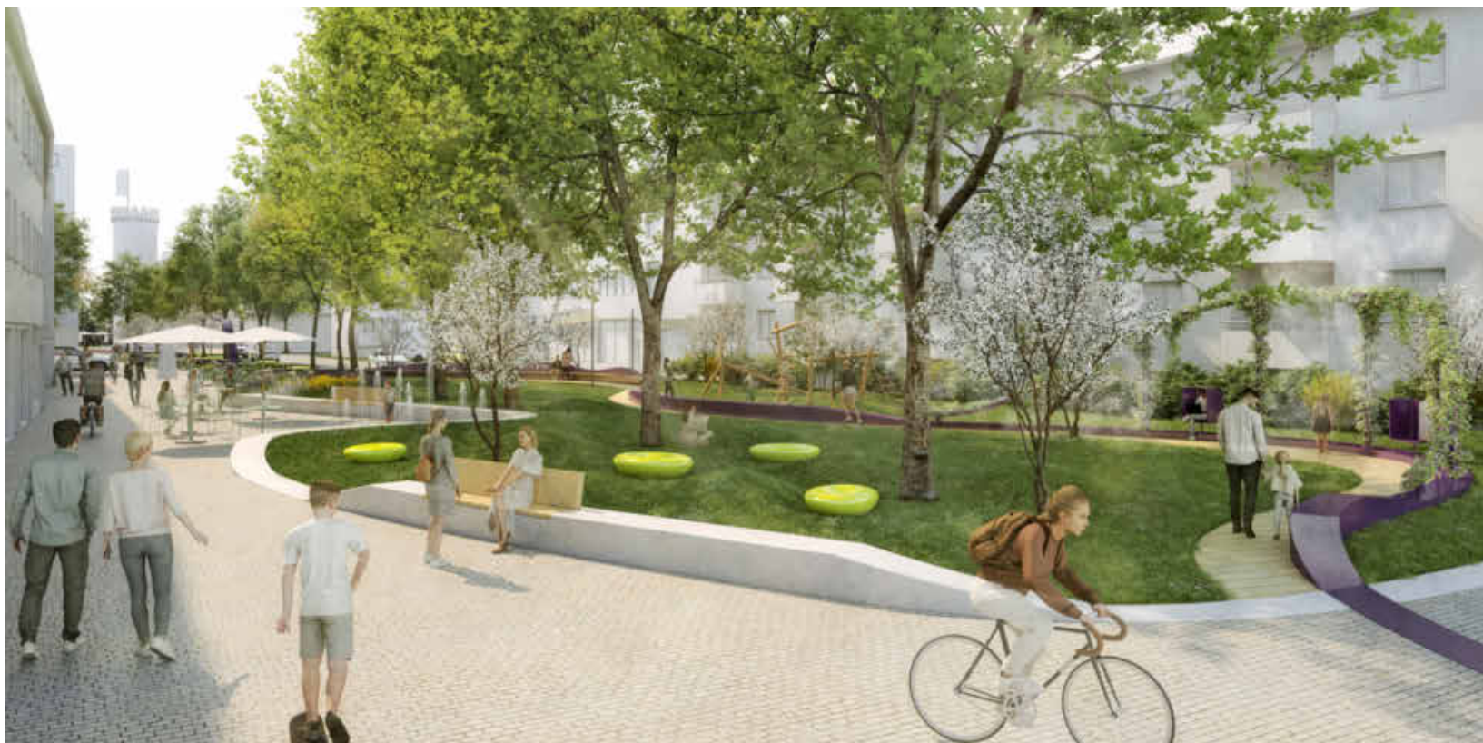
Wo heute noch der Verkehr dominiert, könnte in einigen Jahren eine grüne Oase entstehen. Durch die Entsiegelung von Asphaltflächen und ein intelligentes Regenwassermanagement würden klimatisch kühle Orte in der hitzebelasteten Stadt entstehen.